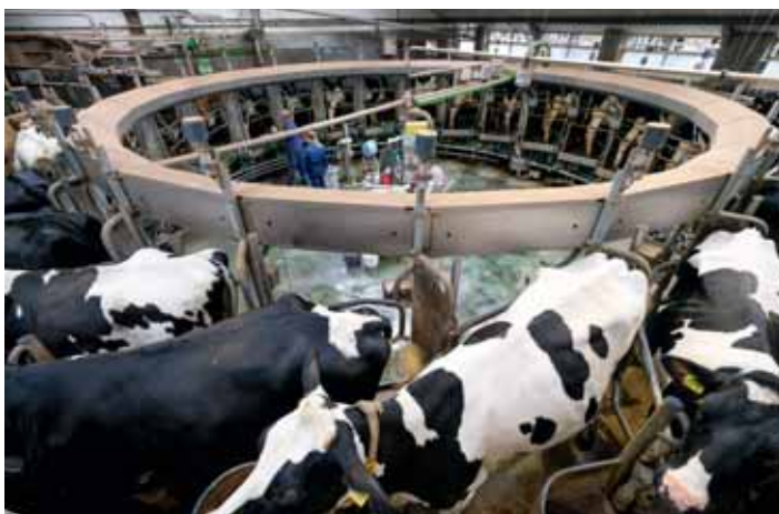
In de 24-stands binnenmelker duurt het drie uur om de koeien te melken.

stal van de jongste kalfjes is verbouwd. Er zijn nu strohokken en de kalfjes krijgen melk met de melkbar. "Mijn vader voert de kalfjes nog elke dag. Sinds drie jaar voeren we geen volle melk meer, maar kunstmelk. Nu hebben we nagenoeg geen last meer van schijterij." ■