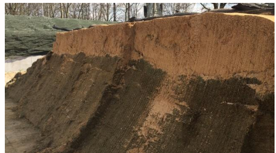
Bierbostel op graskuil