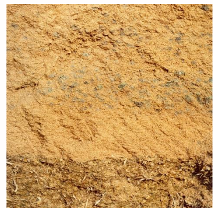
Bierbostel met pulp op maïs