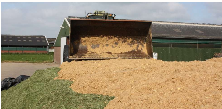
Glucos op graskuil

Bel voor meer informatie, een rantsoeninventarisatie, aflevermogelijkheden en/of uw bestelling naar uw vertegenwoordiger of naar onze verkoopbinnendienst, telefoon (0252) 536 146.